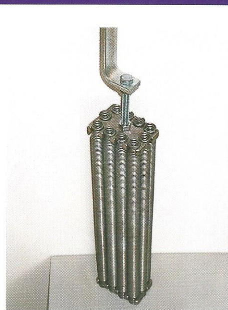
Federpakete für schwere Tore maximal 10 Einzelfedern

Nachrüstung mit dem System an alten Toren problemlos möglich.